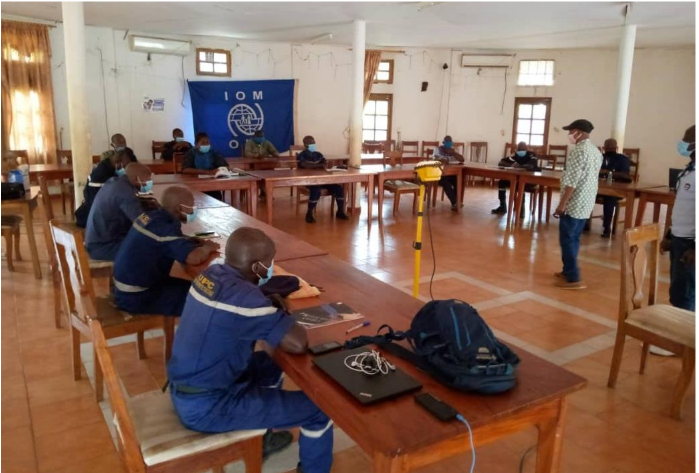
Séance des travaux de groupe sur le SIMEX de table ayant permis aux cadres de DRS et DSP de s'approprier des SOP et guide USAGE