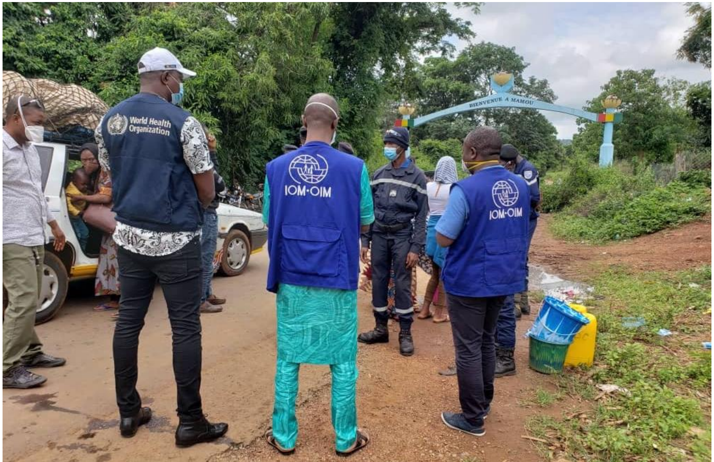
Supervision des barrages sanitaires autour de la ville de Mamou